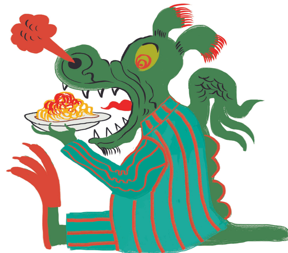
Illustrazione di Andrea Calisi

I volumi presentano inoltre caratteristiche di alta leggibilità perché vogliamo che siano leggibili da tutti! Fantastico, no?